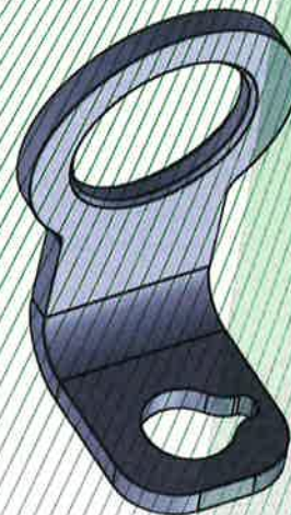
Bild 2: Anschlagöse Typ: TS-Lasche (TS-011) (mit Sollbruchstelle)